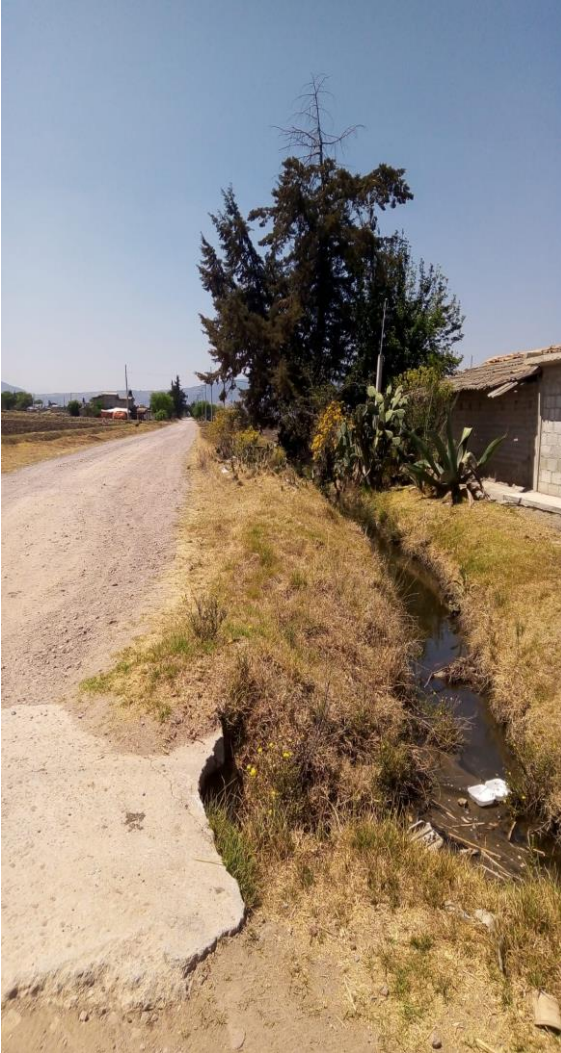
Fauna de la comunidad Trabajo de campo, marzo 2022