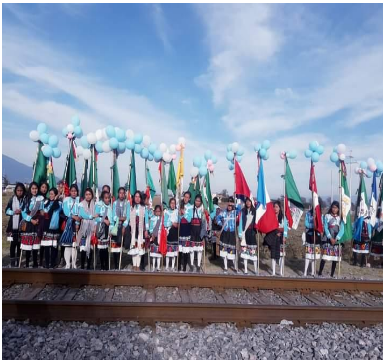
Fotografía compartida por informante del grupo "Virgen de la Asunción", agosto 2020

pertenecer a este grupo las mujeres deben ser puras con la virginidad intacta. Nadie de la comunidad tiene permiso de tocar las banderas y de cargar la imagen de la Virgen, las mujeres son las únicas cuidadoras, este grupo lo conforman alrededor de treinta mujeres, sus edades oscilan entre los diez a los treinta años aproximadamente.