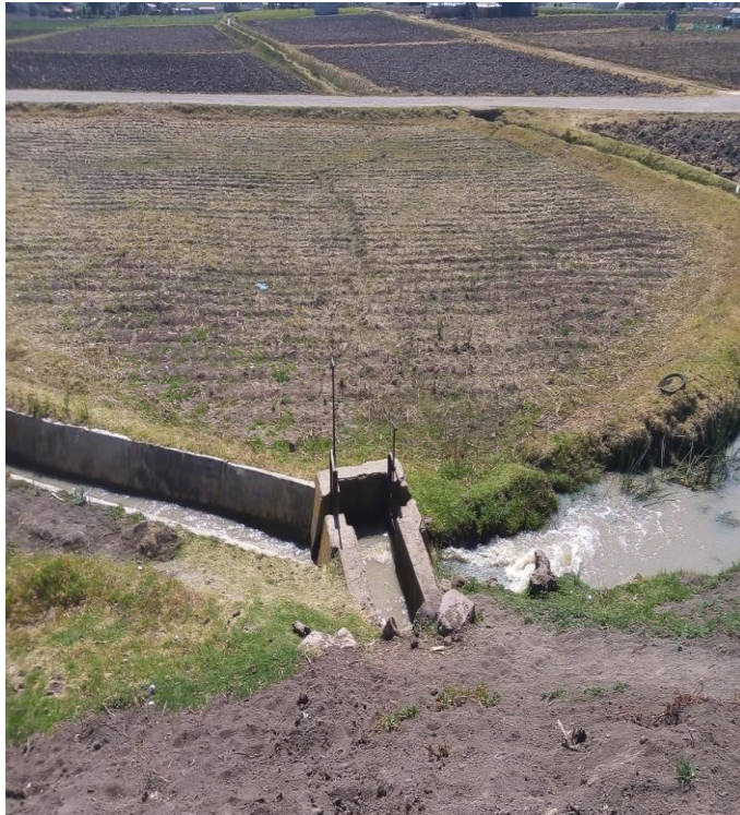
Compuertas abiertas de la presa para que las personas de la comunidad empiecen a regar.

En cuanto a los cultivos para la preparación de la tierra, las milpas anteriormente se regaban con el agua del río Lerma, pero no era suficiente y con la llegada de las industrias el agua se contaminó, por lo tanto decidieron regar con el agua de la “Presa Larga” la cual también es compartida con la comunidad de San Mateo. Los trabajos de la milpa empiezan con el riego en el mes de marzo, después al pasar 15 o 20 días se empieza a con el barbecho, para esto llegan a ocupar el tractor y algunos otros la yunta. En el mes de abril se empieza con la siembra para que los elotes se den a finales de agosto y principios de septiembre, las cosechas se dan en noviembre.