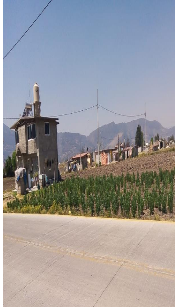
Cultivos de haba Trabajo de campo, marzo 2022