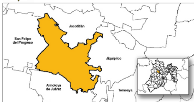
Localización de Guadalupe Cachi

Guadalupe Cachi, Ixtlahuaca, México (150420007)