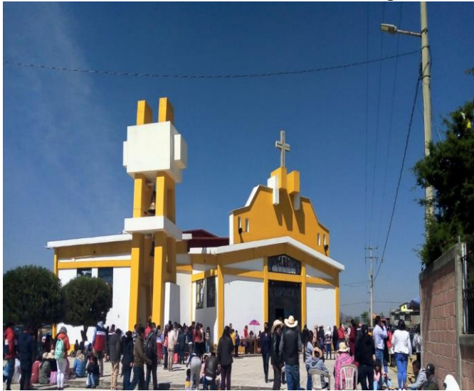
Iglesia nueva, retiro de comunidades Fotografía tomada en trabajo de campo Marzo 2022

La comunidad de Guadalupe Cachi cuenta con diversas festividades religiosas, las personas de esta comunidad tratan de seguir conservando su originalidad, aunque con el paso del tiempo se ha complicado, debido a que el sistema de cargos cambia cada tres años y con ello llegan nuevas propuestas para realizar las celebraciones. Dentro de estas festividades participan los fiscales, catequistas, celebradores, sacristías, recolectores, comité de obras