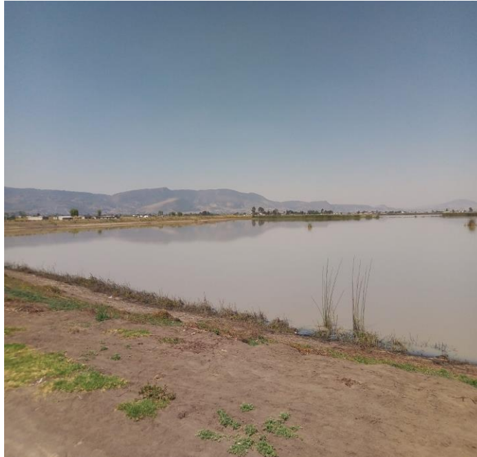
Flora de la Comunidad de Guadalupe Cachi

De acuerdo con los pobladores se ha visto que con el paso del tiempo se ha llegado haber un deterioro ecológico en donde los cambios de clima, el uso de la tierra y la caza han provocado la desaparición de diversos animales que habitaban en la comunidad, entre los que se encuentra el coyote, zorrillo, cacomiztle, tlacuache,