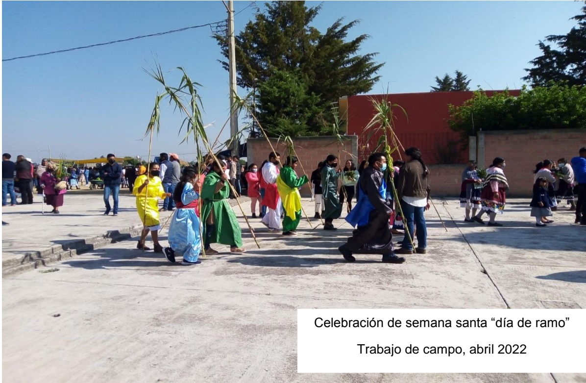
Celebración de semana santa “día de ramo” Trabajo de campo, abril 2022