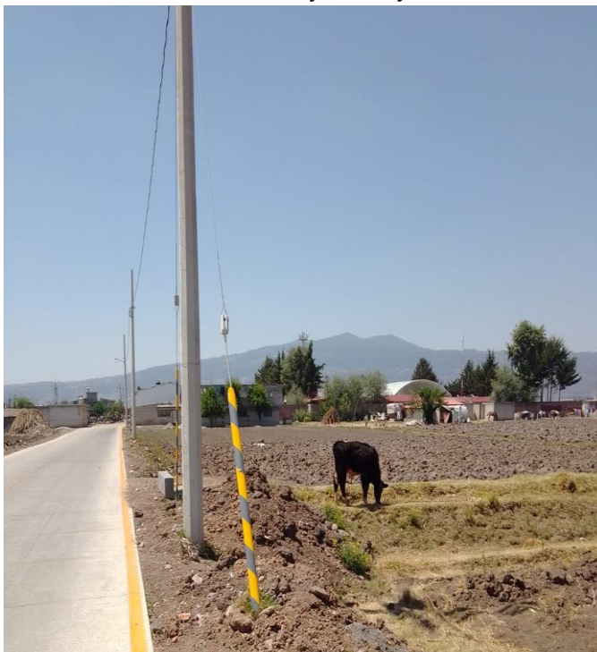
En las orillas de las milpas se pueden ver animales como vacas y borregos