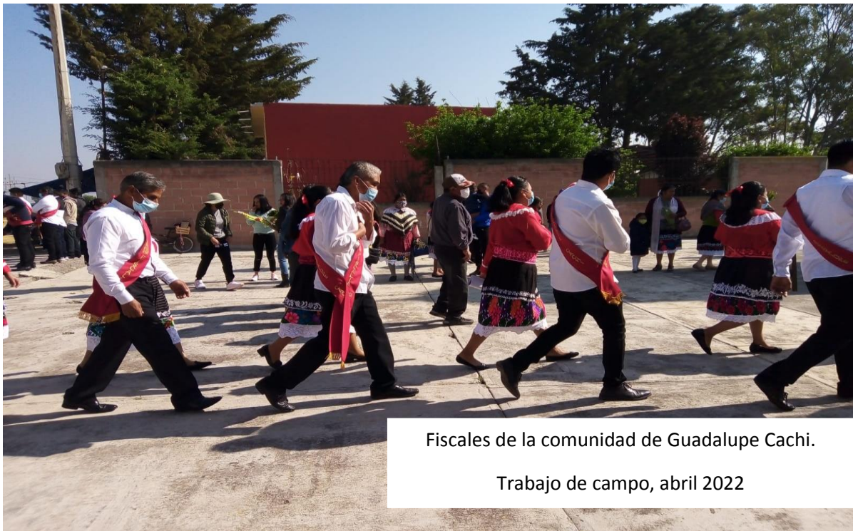
Fiscales de la comunidad de Guadalupe Cachi. Trabajo de campo, abril 2022